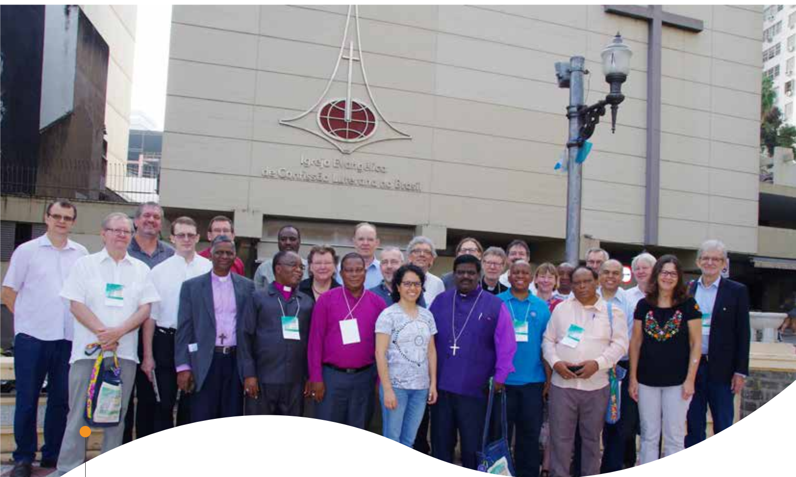
Die TeilnehmerInnen der PKK 2019 in Porto Allegre kamen aus vier Kontinenten.

Die Bedeutung gemeinsamen kirchlichen Handelns wurde bekräftigt. Gespräche zwischen Kirchenleitungen aus Brasilien und Südafrika bestätigten, dass Süd-Süd-Kooperation und das Teilen von gemeinsamen Fragen und Problemen bereits praktiziert werden. Dies ist ein gutes Beispiel dafür, wie die Zusammenarbeit in der Mission in Zukunft weiterentwickelt werden kann.