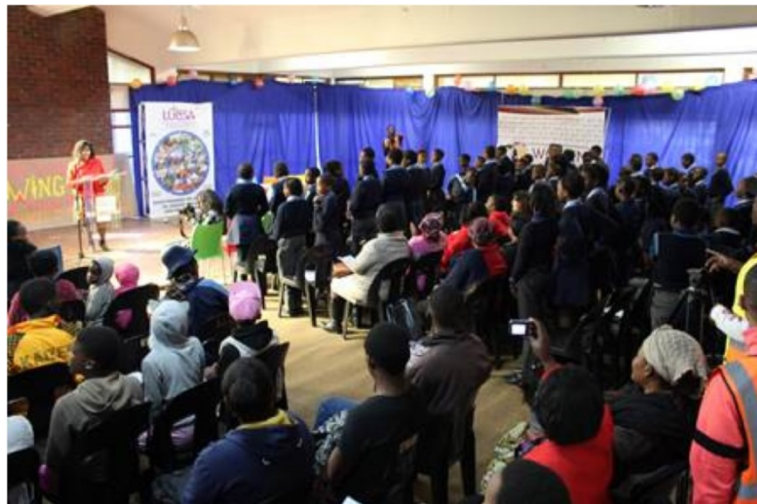
Workshop mit MigrantInnen aus 14 Staaten