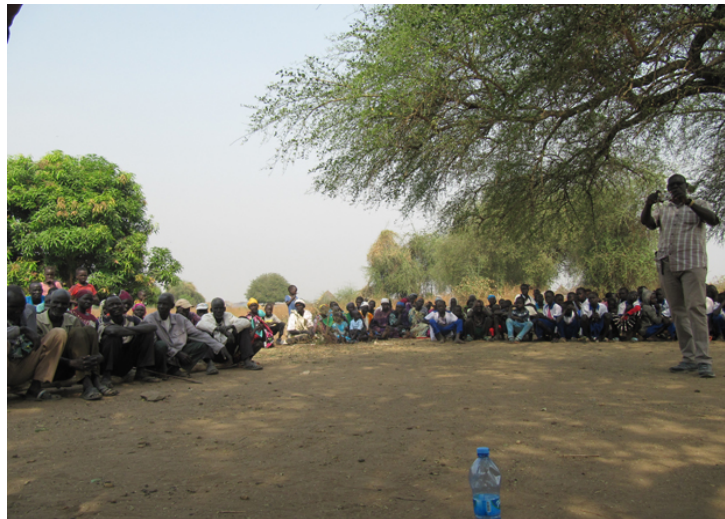
Beim Besuch in Lare Jekow erläutert ein Sozialarbeiter die Arbeit